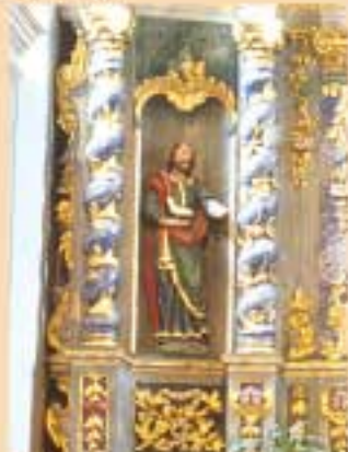
La colombe du Saint-Esprit